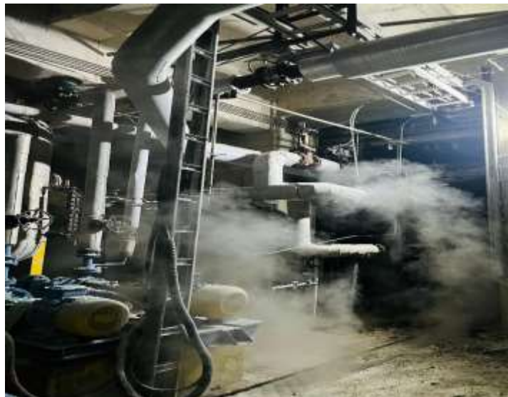
Gambar 1.1 Asap dari hasil pembuatan Tissue

Seperti contohnya di PT. Lontar Papyrus khususnya di TM 1.2 polusi udara seperti CO 2 dan partikulat lainnya tentu ada dan perlu di monitoring agar kualitas udara di area tersebut dapat terjaga dan dapat menghindarkan para pekerja dari efek samping bahaya kesehatan karena polusi udara.