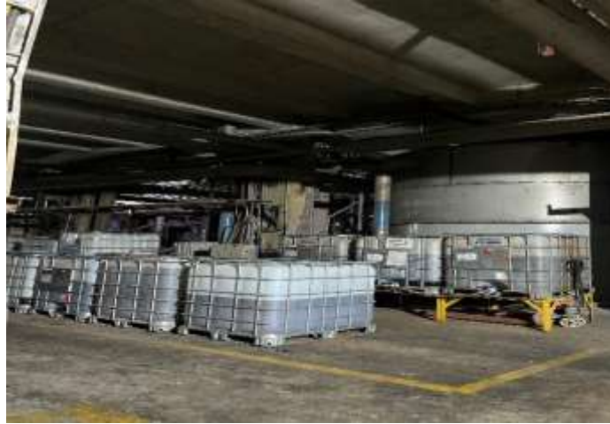
Gambar 1.2 Area penyimpanan chemical

Pada gambar 1.2 adalah area penyimpanan chemical yang berada di dalam lingkungan industri, di khawatirkan ketika terjadi kebocoran pada tank chemical maka akan langsung dibawa oleh angin menuju area produksi.