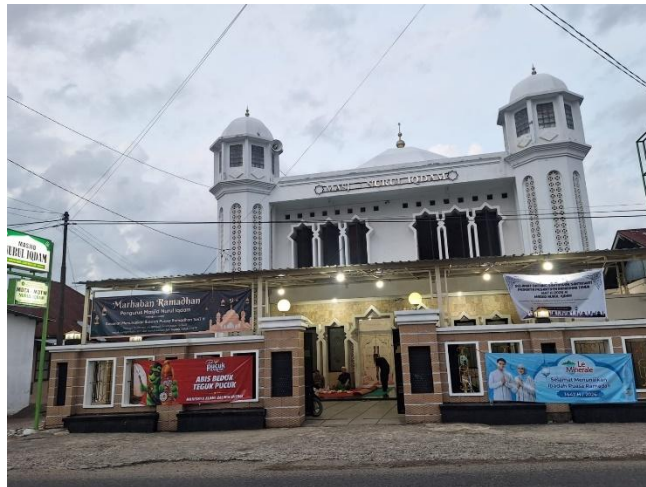
Gambar 1.1 Masjid Nurul Iqdam

yang diadakan setiap hari setelah sholat ashar dan maghrib; dan kegiatan Taraweh beserta ceramah ramadhan yang dilakukan selama bulan ramadhan tiap tahunnya. Untuk menunjang aktifitas-aktifitas tersebut, butuh kondisi yang kondusif dan nyaman terutama pada sistem pencahayaannya. Hal ini dikarenakan banyaknya aktifitas yang memerlukan pencahayaan yang baik seperti TPA/TPQ yang fokus belajar membaca dan mempelajari Al-Quran, Wirid, Majelis Taqlim serta kegiatan taraweh dan ceramah ramadhan yang dihadiri oleh jamaah yang kebanyakan sudah memasuki kategori dewasa awal dan lansia yang sangat membutuhkan pencahayaan dikarenakan kondisi pengelihatannya yang semakin menurun seiring berjalannya waktu.