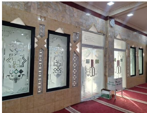
Gambar 1.2 Kondisi Pencahayaan mesjid pada siang hari

Untuk melakukan perancangan terhadap sistem pencahayaan agar efisiensi daya dan tepat sasaran, Melalui analisis dan perancangan sistem pencahayaan berbasis standar SNI, diharapkan Masjid Nurul Iqdam dapat memiliki sistem pencahayaan yang tidak hanya nyaman bagi jamaah, tetapi juga hemat energi dan berkelanjutan. Penelitian ini menjadi penting untuk memberikan solusi teknis yang tepat dalam meningkatkan kualitas pencahayaan masjid, sekaligus mendukung program efisiensi energi SNI 6197:2020 (Indonesia): Konservasi energi pada sistem pencahayaan dan SNI 03-6575-2001 (Indonesia): Tata cara perancangan sistem pencahayaan buatan pada bangunan gedung