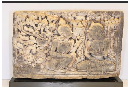
Batu relief peninggalan masa kerajaan Majapahit yang dicuri di Amerika Serikat

Kasus perdagangan ini tidak hanya lokal. Otoritas New York menyita dan menyerahkan tiga artefak etnografi Indonesia (batu relief peninggalan masa Kerajaan Majapahit, patung perunggu arca Buddha dalam posisi duduk, serta patung perunggu arca Dewa Wisnu dalam posisi berdiri) hasil penyelundupan yang diperdagangkan di pasar seni AS, dengan nilai barang mencapai 405 ribu USD. 8