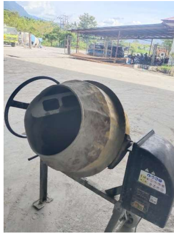
Pembuatan Benda Uji