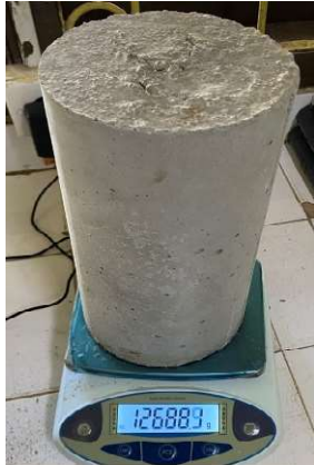
Penimbangan Benda Uji