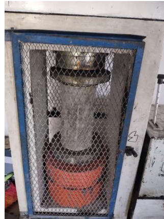
Proses Pengujian Benda uji