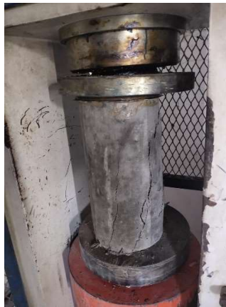
Keretakan Benda Uji setelah proses pengujian