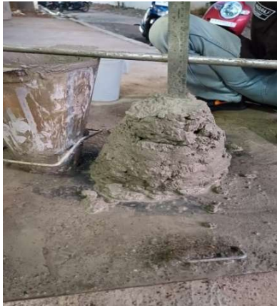
Pengujian Slump Test