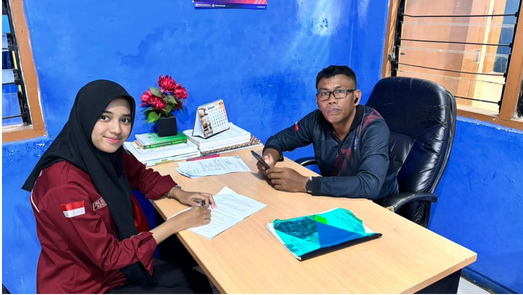
Foto Bersama Kepala Seksi Pembinaan Pengawasan Penyuluhan Di Bidang Penegakan Peraturan Perundang Undangan Daerah Satpol Pp Kota Padang